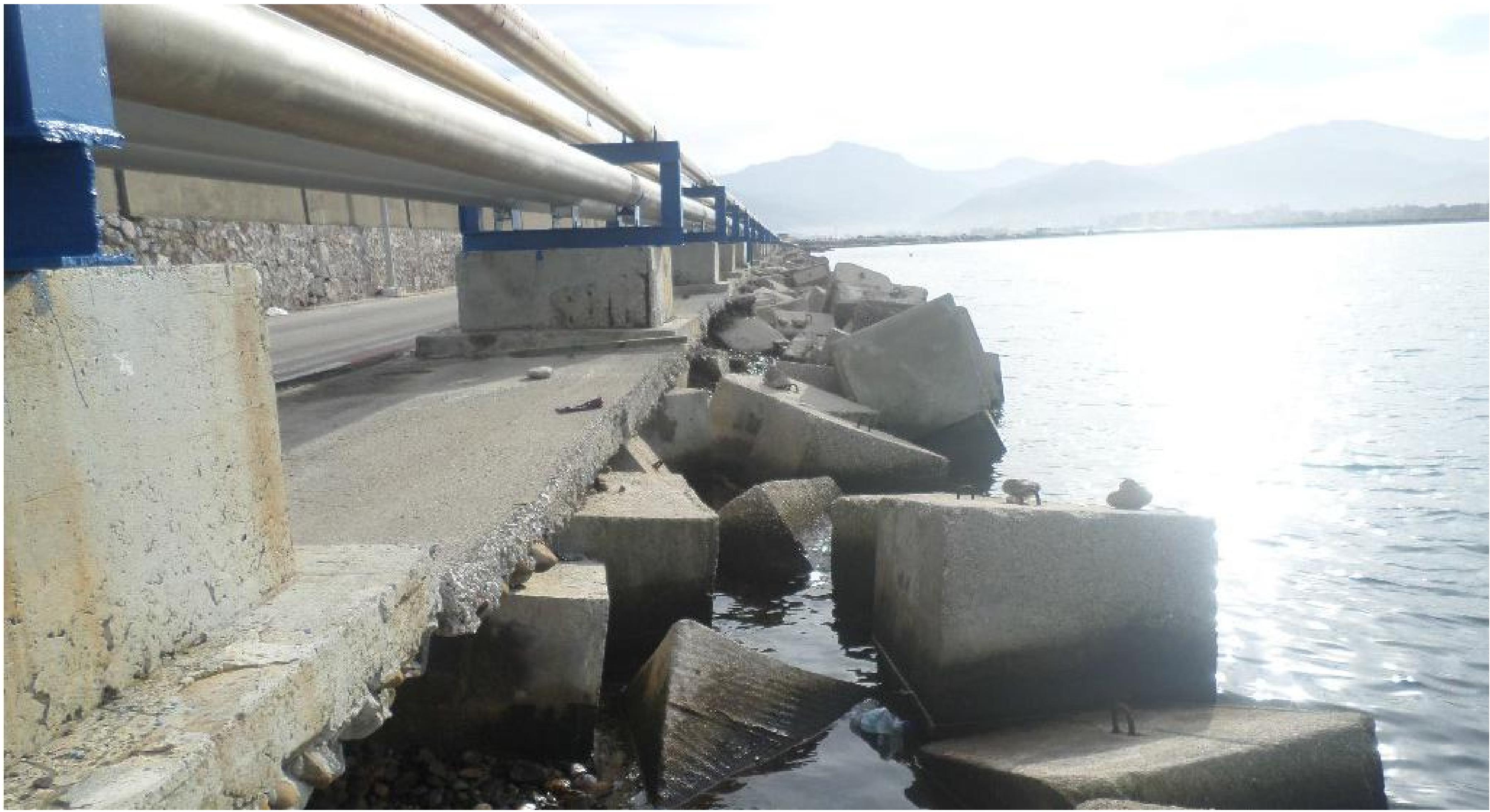
L'état des socles avant confortement