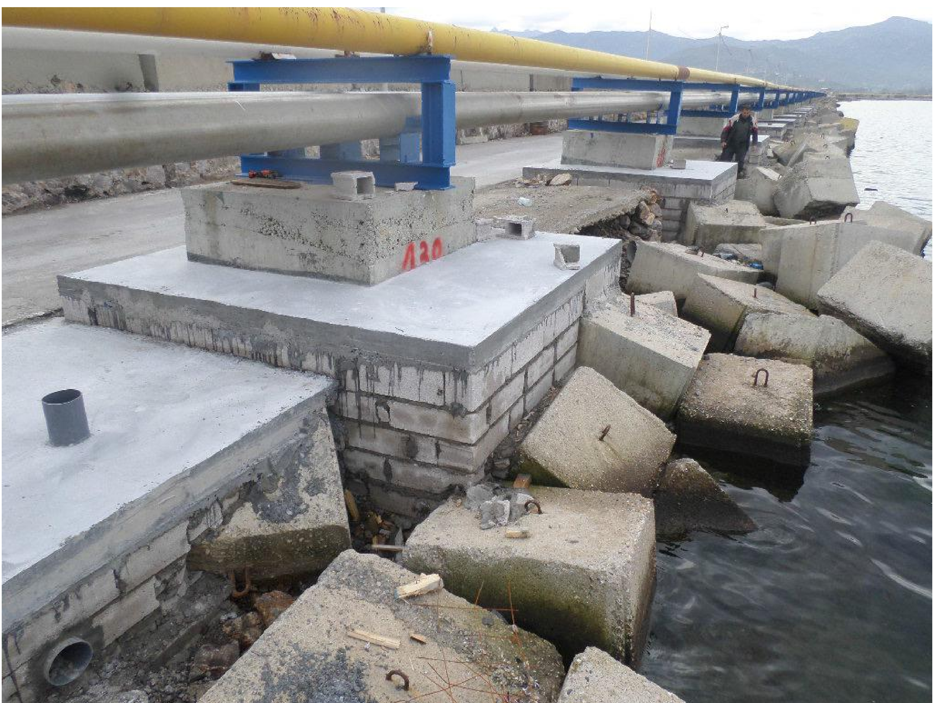
L'état des socles après confortement

Ces dégradations sont dues principalement aux facteurs naturels (tempêtes, franchissements des vagues, agressivité du milieu marin ainsi que l'obturation des renifleurs existants...).